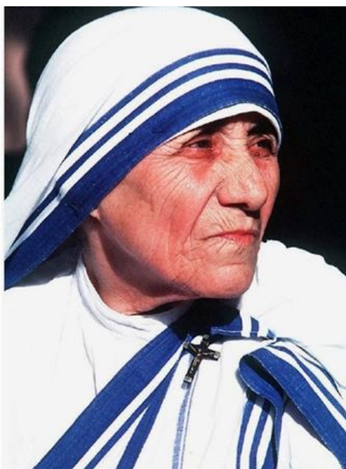
Sw. Teresa z Kalkuty

Dasz światu z siebie wszystko, a wybiją ci zęby. Mimo to daj światu z siebie wszystko!